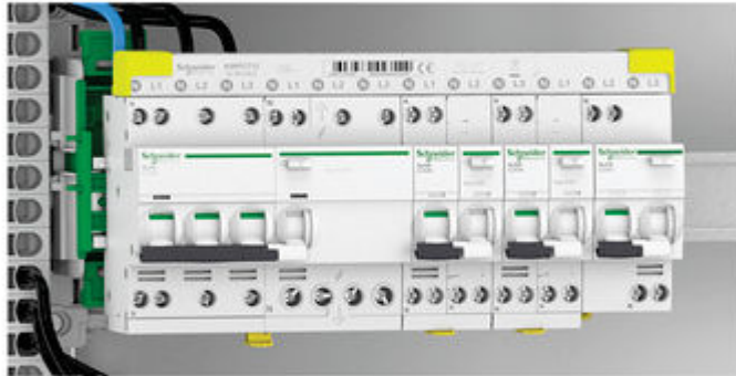
Image of assembly of product